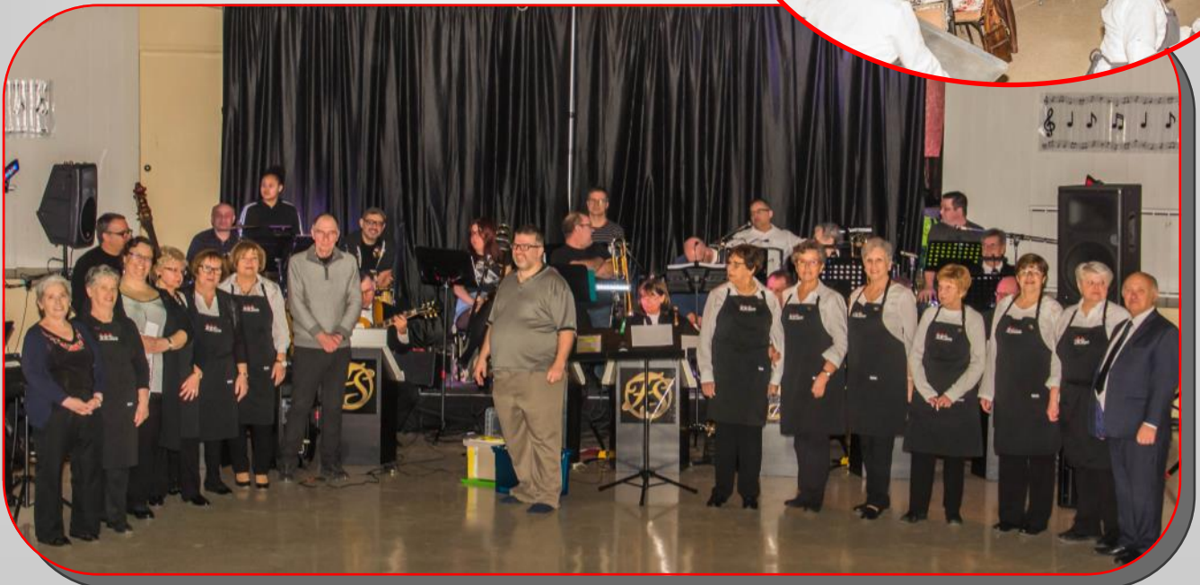
Soirée Vintage Big Band