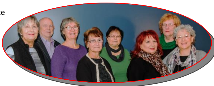
Les membres du Conseil d'administration