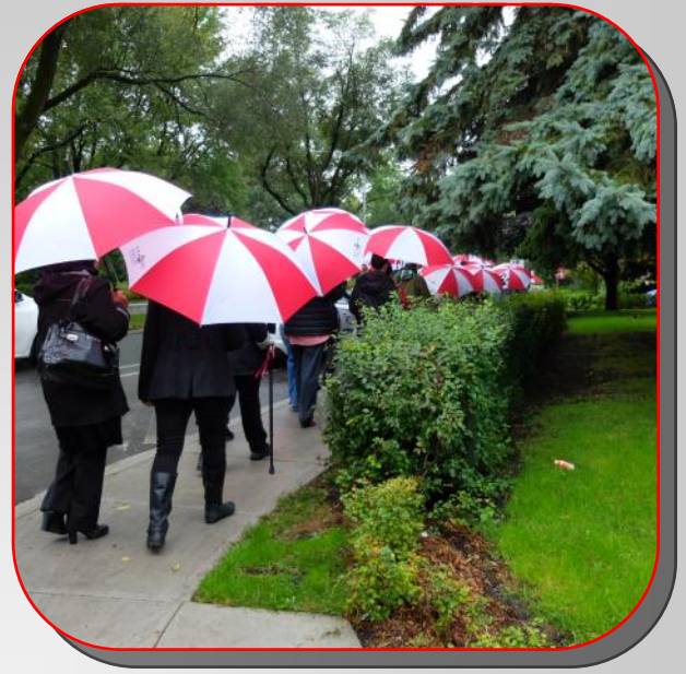
Marche locale des parapluies pour Centraide

Tout au cours de l'année, le SAC Anjou a été le lien privilégié entre le milieu communautaire et la Commission scolaire de la Pointe-de-l'Île et ce, aussi bien sur le plan éducatif de la commission scolaire que sur celui de l'école secondaire. Il y a eu une collaboration entre les différents partenaires d'Anjou de la Zone angevine de persévérance scolaire (ZAPS) pour faciliter l'impact positif sur la réussite éducative des jeunes d'Anjou. Par exemple, les jeunes ont pu dessiner leur rêve dans les vitrines des commerces d'Anjou, ce qui démontre une belle ouverture de la part des commerçants participants.