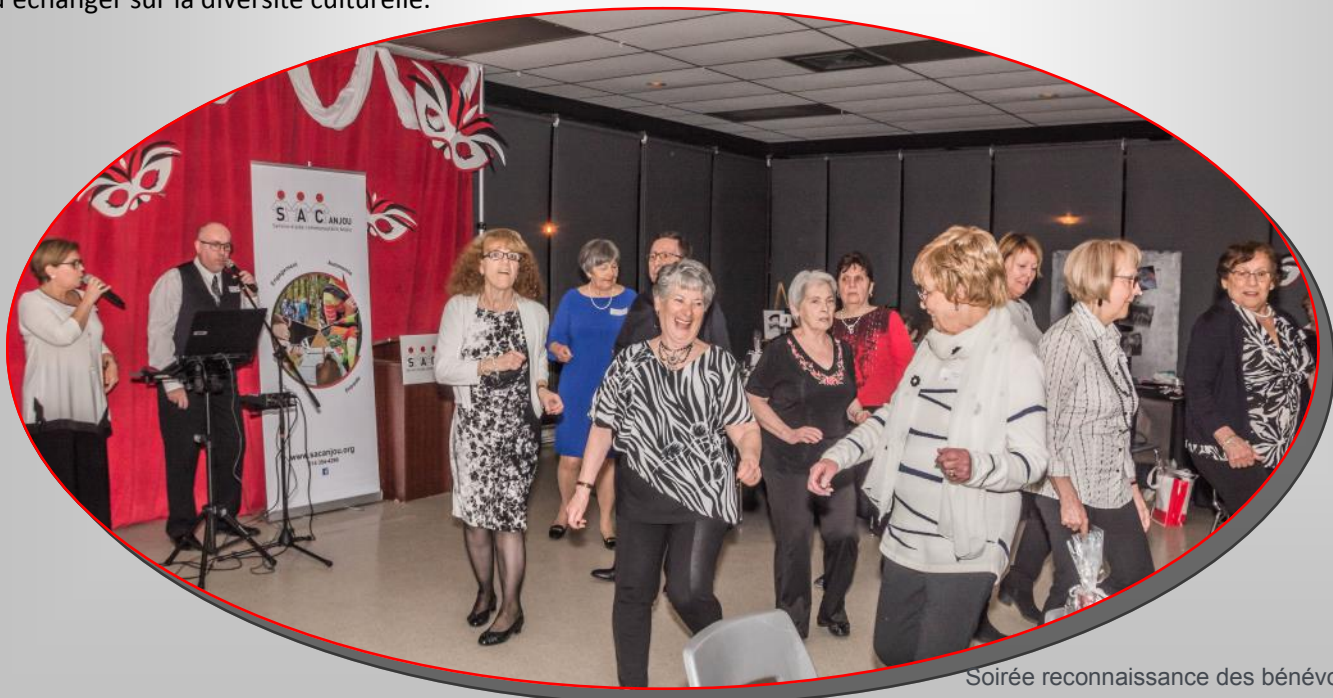
Soirée reconnaissance des bénévoles

Soirée reconnaissance Médaille du lieutenant-gouverneur du Québec Formation pour les bénévoles