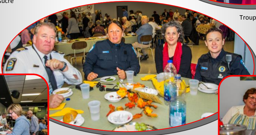
Festival de la soupe