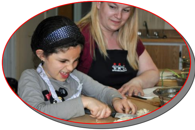
Cuisine pour les 6-11 ans