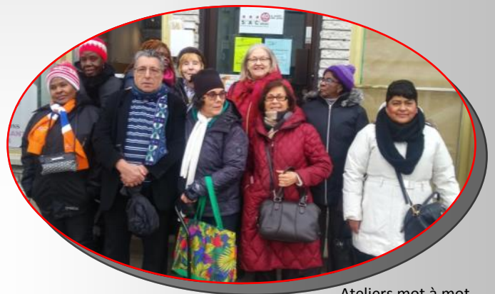
Ateliers mot à mot

« Depuis mon arrivée aux Ateliers mot à mot, je me suis beaucoup améliorée sur tous les plans. Les cours de français m'ont permis de parler correctement et d'écrire mieux. Les activités et les sorties auxquelles j'ai participé m'ont apporté beaucoup de bien ainsi qu'à mes enfants. »