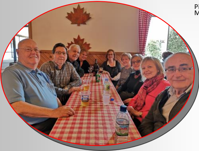
Sortie à la cabane à sucre