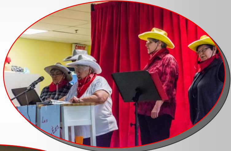
Troupe d'humour Les Anjoués