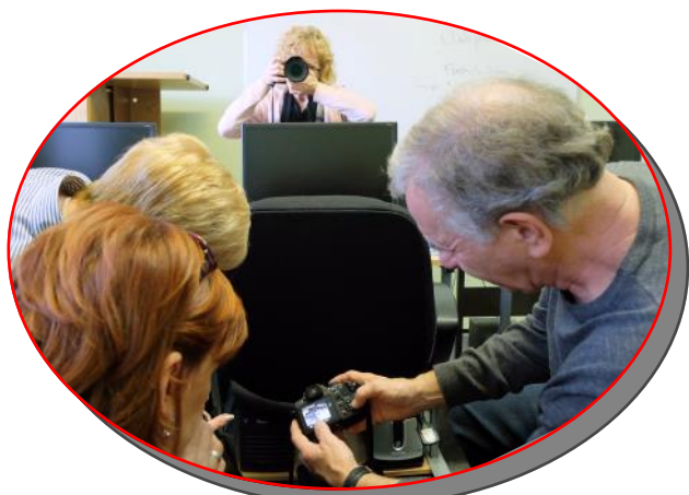
Atelier : Fonctions de la caméra numérique